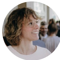
Jet Kiks Ontwerper (mobiliteits) hubs en leefomgeving

Royal HaskoningDHV heeft ervaring met de ontwikkeling van verschillende (mobiliteits) hubs. De ontwikkeling van een hub is, vanwege de vele belanghebbenden en de vele mogelijkheden, een complex proces. Ons team van hubexperts weet welke voorwaarden er nodig zijn om de ontwikkeling én realisatie van een hub te laten slagen.